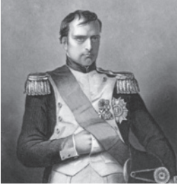
Napoleon verslaan 1815

Op het geschiedenisboek van Kobe zitten vlekken. Vul jij aan zodat de jaartallen kloppen?