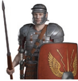
einde Romeinse Rijk 476